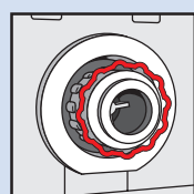
Empreinte FLEX — Orientable par tranche de 30° — Raccord denté