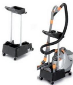
CHARIOT DE TRANSPORT UP30001NXUN