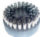
GRANDE BROSSE RONDE POILS INOX KIT0814/I