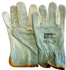
GANTS DE SÉCURITÉ KIT0020