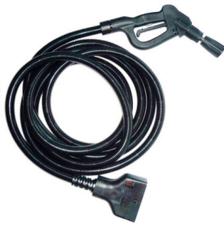
FLEXIBLE INDUSTRIEL DE 10 MÈTRES AVEC PISTOLET À RACCORD RAPIDE KIT9808/QR10