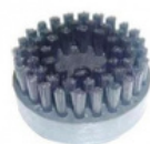
GRANDE BROSSE RONDE POILS NYLON KIT0814/N