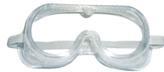
LUNETTES DE PROTECTION KIT0021